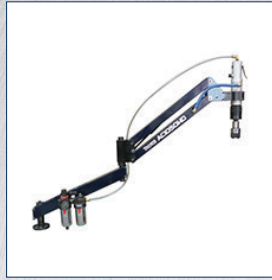
PORTE-OUTIL UNIVERSEL TR1500-U500 262505 3 562.00 $