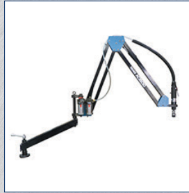
PORTE-OUTIL RIGIDE TR1000-R500 262496 2 030.00 $