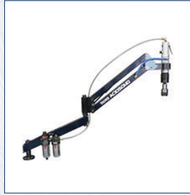
PORTE-OUTIL UNIVERSEL TR1050-U875 262509 4 090.00 $