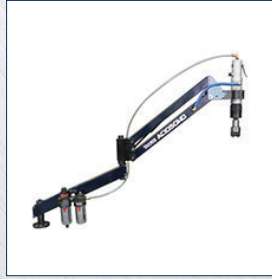
PORTE-OUTIL RIGIDE TR1050-R875 262508 3 587.00 $