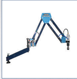
PORTE-OUTIL RIGIDE TR1500-R500 262502 3 132.00 $