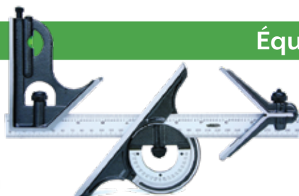
ACCESSOIRE OPTIONNEL: Règles rigides 283006