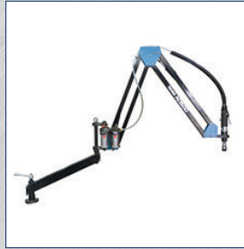
PORTE-OUTIL RIGIDE TR1000-R500 262496 1 827.00 $