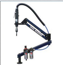
PORTE-OUTIL UNIVERSEL TRS1000-U375 262500 2 228.40 $

Filtre, régulateur et lubrificateur pour votre conduite d'air et assurer que votre moteur de taraudage fonctionne en douceur et efficacement.