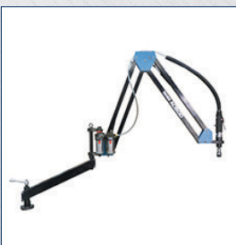
PORTE-OUTIL RIGIDE TRS1000-R375 262497 1 827.00 $