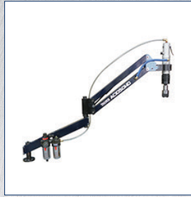
PORTE-OUTIL UNIVERSEL TR1500-U500 262505 2 818.80 $