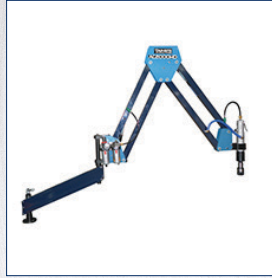
PORTE-OUTIL RIGIDE TR1500-R500 262502 2 818.80 $