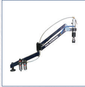
PORTE-OUTIL UNIVERSEL TR1050-U875 262509 3 681.00 $