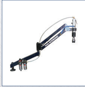
PORTE-OUTIL RIGIDE TR1050-R875 262508 3 228.30 $